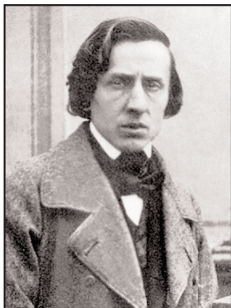
Fryderyk Chopin 1810-1849

TEMAT: Z okazji 150. rocznicy urodzin Ignacego Jana Paderewskiego oraz 200. rocznicy urodzin Fryderyka Chopina, wybitnych polskich kompozytorów i pianistów prosimy o wykonanie pracy inspirowanej życiem i twórczością jednej z postaci.